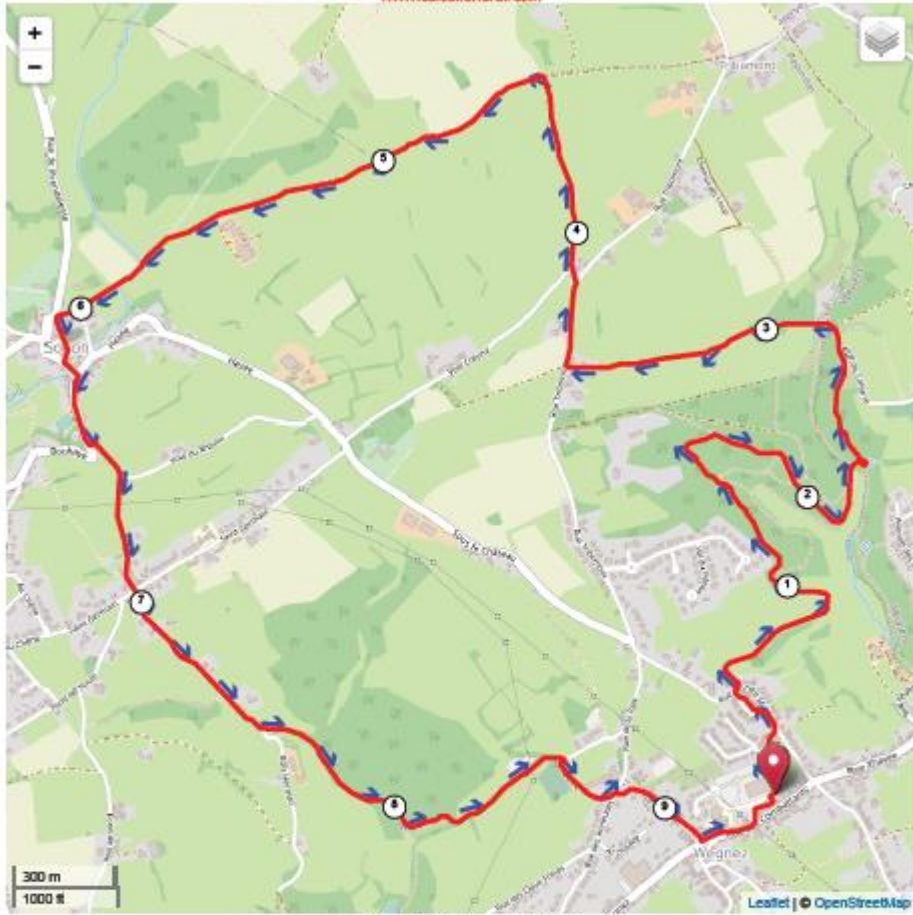
Mon parcours sportif [ 9452 m - 9.45 km ]